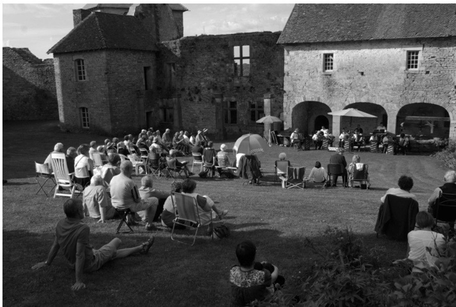
Concert du 7 mai

Samedi 10 septembre 2016 : festival de jazz. A partir de 18h00, 7 groupes se succéderont sur deux scènes : Vesoul Jazz Orchestra, Kirchmeyer, SEBV, Cube Trio, Passage, Lucky People et Social Groove. Festival organisé par l'association "Bled'Arts". Prix d'entrée sur place : 20€/15€ (15 €/10 € en prévente).