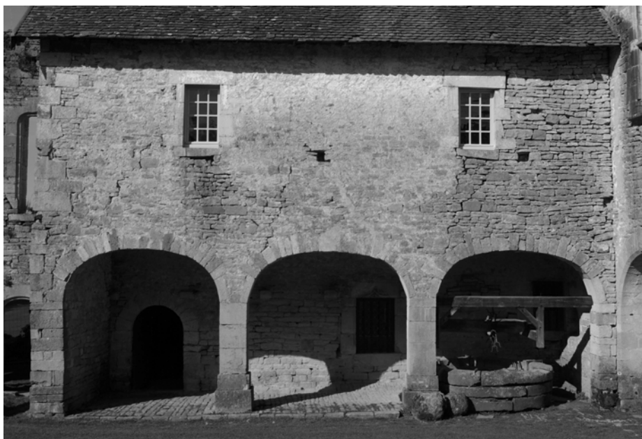
Galerie XVIII e : chassis de fenêtre posés en avril