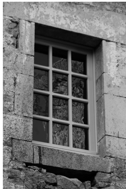
Galerie XVIII e : détail

de la courtine au droit de l'entrée de la haute cour, restauration des parements de la "viorbe" et pose de menuiseries dans cette tourelle et sur la galerie – voir journal n° 26). L'ensemble de ces travaux, pour un montant total de 24 861,79 €, a été financé à 50% par l'État au titre de l'entretien sur MH classé. Les fournitures nécessaires à la confection des menuiseries et vitreries, s'élevant à 5 523,79 € TTC, ont été prises en charge par la SHAARL (Société d'Histoire et d'Archéologie de l'Arrondissement de